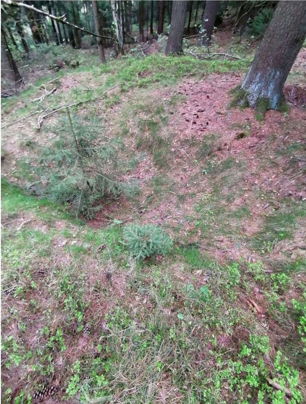
Obrázek č. 1/2